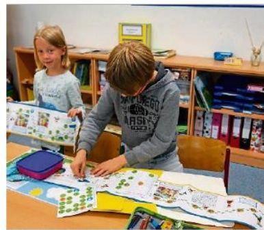
Stolz zeigen die Schüler ihre Meilenhefte.

Darüber hinaus sei das Thema Klimaschutz auch im laufenden Schuljahr ein wichtiges