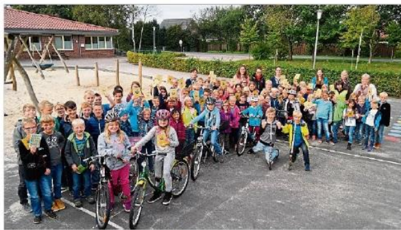
Die Kinder der Grundschule Ober-/Niederlangen nahmen aktiv am Klimaschutzprojekt teil.

Grüne Meilen konnten die Kinder für umweltfreundlich zurückgelegte Wegesammeln, blaue Meilen für Energiesparen und rote Meilen für regionale Lebensmittel. Im Unterricht durften die Kinder dann Sticker in ein Heft einkleben,